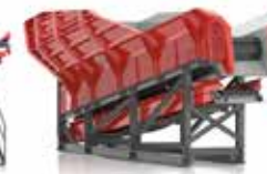
PB 130 Alimentateur à tabliers métallique avec bande d'évacuation du rebut