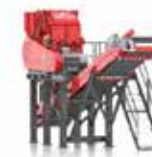
P 090 Concasseur à percussion stationnaire avec convoyeur d'extraction