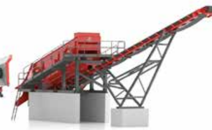
S 1860-4 Cribleur stationnaire avec tapis de décharge