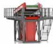
STS 140 Crible à étoiles stationnaire