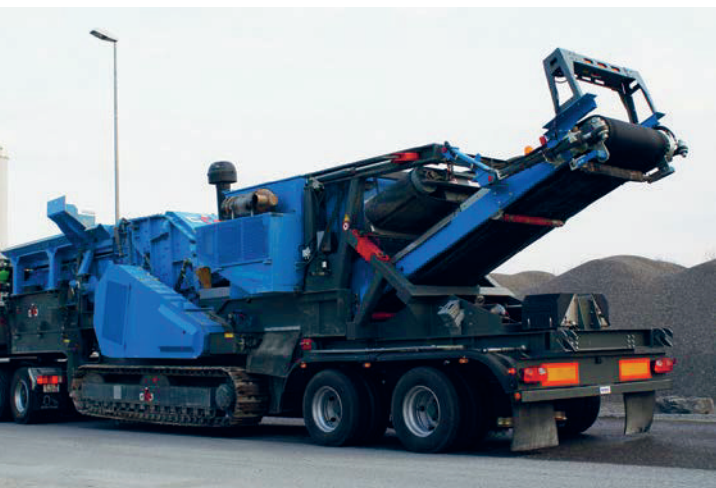
R 100 FDR GIGA mit 2-Achs-Transportsystem