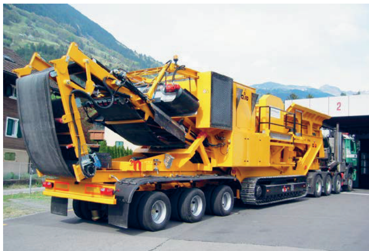
B 1170 C GIGA mit 3-Achs-Transportsystem